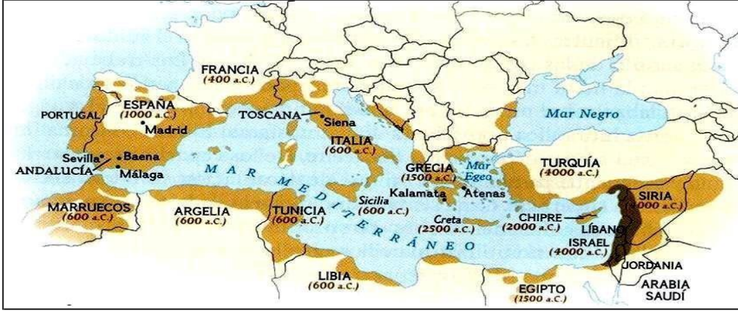
Şekil 1. Zeytin Üretimini Yayıllığı

Kutsal zeytin ağacı; Akdeniz uygarlığının sembolüdür. Tüm dünyada 900 milyon ağaçtan % 98' i Akdeniz çanağında yer almaktadır.